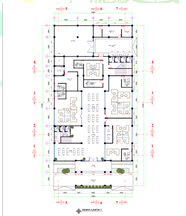
Gambar 1 Denah Lantai 1

Pada metode konvensional pemindahan beban plat lantai ke balok pemikul berda sarkan pentederhanaan teori bidang retak pada plat. Pola pembebanan pada tiap lantai dapat dilihat sebagai berikut.