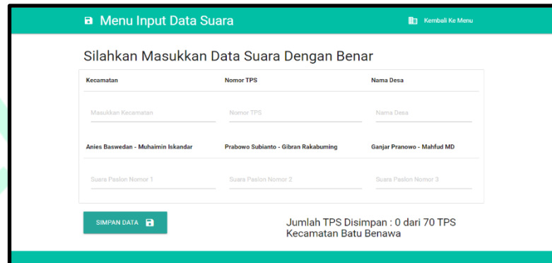
Gambar 2 Input Hasil suara

telah disahkan dan ditandatangani oleh ketua tempat pemungutan suara setempat. Kemudian ketika semua data telah dimasukkan, cara menyimpan data adalah dengan mengklik tombol Simpan Data kemudian data yang disimpan akan bisa dilihat di halaman List Data